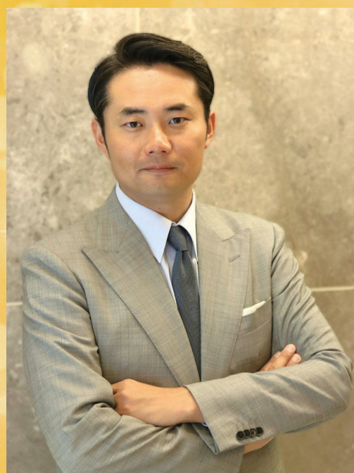
杉村 太蔵(すぎむら たいぞう)氏 プロフィール

1979年8月13日、北海道旭川市出身。2004年3月筑波大学中退。派遣社員から外資系証券会社勤務を経て、2005年9月総選挙で最年少当選を果たす。厚生労働委員会、決算行政監視委員会に所属。労働問題を専門に、特にニート・フリーター問題など若年者雇用の環境改善に尽力。慶應義塾大学大学院メディアデザイン研究科後期博士課程 所定単位取得退学。現在、テレビ・ラジオ・雑誌などメディアで活動する一方、派遣社員から国会議員、落選して無職からタレントに転身するなど、自身の経験を交えながら語る政治・経済をテーマとした講演活動を全国で行う。また北海道音威子府村と人口減少問題対策・過疎地問題について共同研究を行っている。また、TBS「サンデー・ジャポン」レギュラーコメンテーターなどテレビ・ラジオ出演多数。なお、小学館「バカでも資産1億円」を上梓。趣味のテニスは、元国体で優勝したほどの腕前。私生活では三児の父。