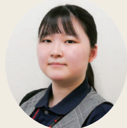
ITソリューション部 システム開発課 (勤続4年) HTさん