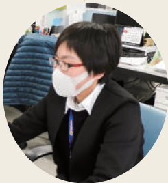
人事総務部 人事グループ(勤続3年)