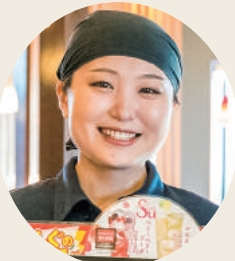
焼肉きんぐ青森観光通り店(入社4年目)