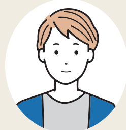
BPO 事業本部 青森業務部 (2020年入社) Aさん