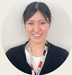
青森中央店営業スタッフ(2年目)