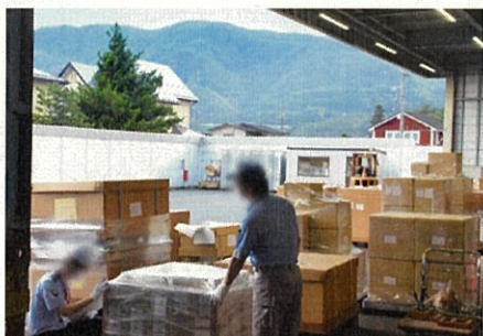
内陸部の保税蔵置場 (長野県内)