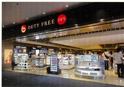
空港型免税店 (那覇空港)