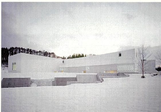
保税展示場 (青森県立美術館)