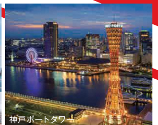
神戸ポートタワー