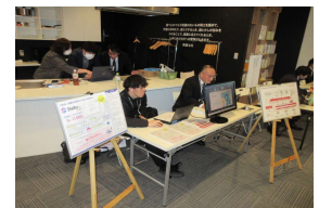
展示・相談コーナー